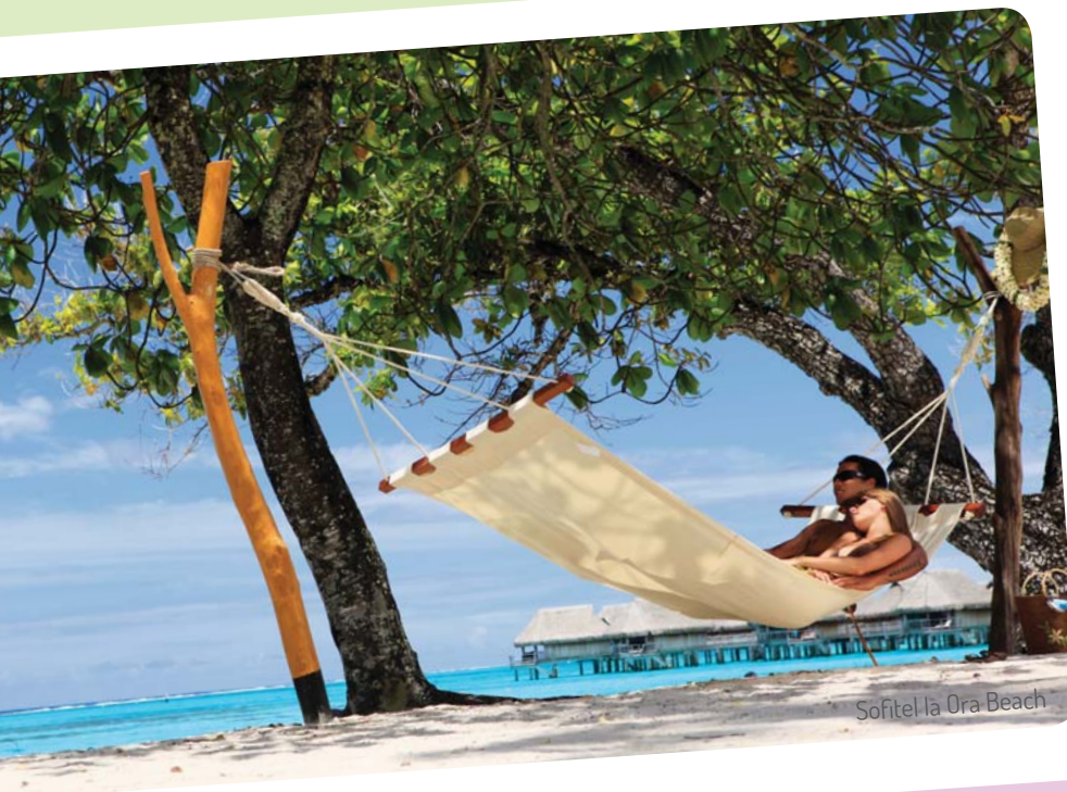
Sofitel la Ora Beach